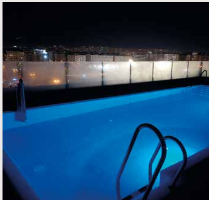
En aftenbadetur fra poolen på taget kan måske lokke?

Hold øje med nyhedsbrevet - hvis du ikke er tilmeldt, kan du tilmelde dig på "mitFOA", eller du kan ringe til os, og så klarer vi den.