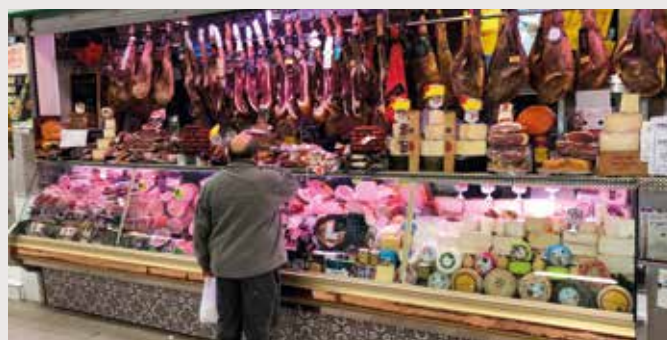
Det lokale madmarked ligger kun 10 minutters gang væk.