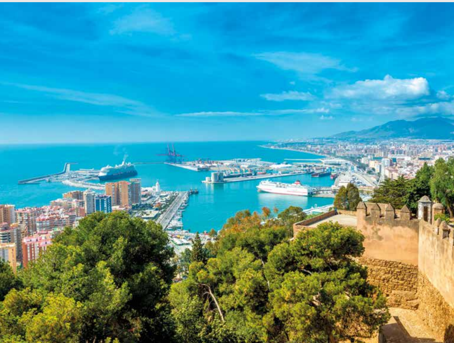
Malaga er den perfekte blanding af by og strand, kultur og historie.