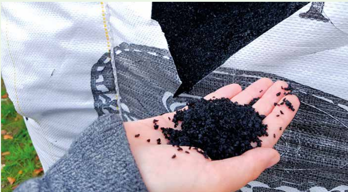
Gummigranulater bliver bl.a. brugt til at bestemme "græsstråenes" længde, og de gør, at kunstgræsplænen føles mere som en ægte græsplæne.

på, hvordan man kan holde gummigranulaterne inde på banen og stoppe dem i at sprede sig ud i naturen. Hvis banen bliver 1 millimeter lavere, betyder det, at der er forsvundet 4,5 ton gummigranulat ud i naturen. Det sker, når bolden rammer banen, og granulaterne hopper op i luften og ud af banen – eller når de ryger ned i brugernes sko og videre ud i verden.