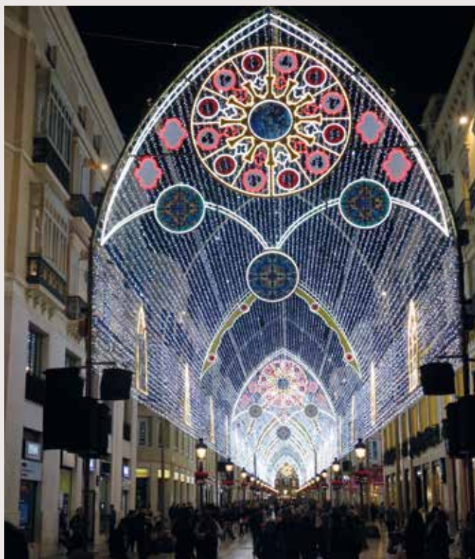
Måske skulle du tage ned og se julelysene i Malaga til december?

I nyhedsbrevet og i Etterens september-nummer kan du se fotos inde fra lejligheden. Forhåbentligt kommer vi også snart med et tilbud om et fransk landhus – det kan du også læse mere om i september-nummeret og de digitale nyhedsbreve.