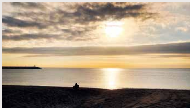
Udsigten over Middelhavet lige ude foran opgangen til lejligheden.

Hold øje med nyhedsbrevet - hvis du ikke er tilmeldt, kan du tilmelde dig på "mitFOA", eller du kan ringe til os, og så klarer vi den.