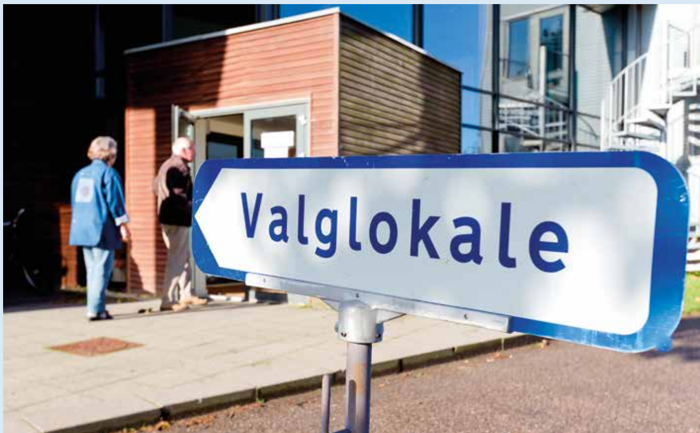
Den 26. maj er der valg til Europa-parlamentet.