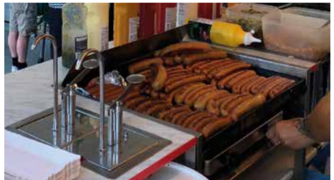
Sommerfesten i 2018 var et hit - vi håber, vejret bliver ligeså fantastisk i år.

Solen har sendt sine smukke stråler ud over landet, og det dejlige vejr passer godt til grill og kolde øl, derfor vil vi gerne invitere alle vores medlemmer til sommerfest i FOA 1.